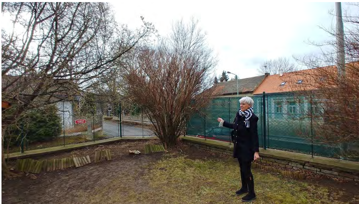
Obr. Keřovitá zeleň – celkem 8ks

Před samotným přesazením se provede seřiznutí keře o 1/3. Další postup bude shodný jako u přesazení vzrostlého stromu viz. výše.