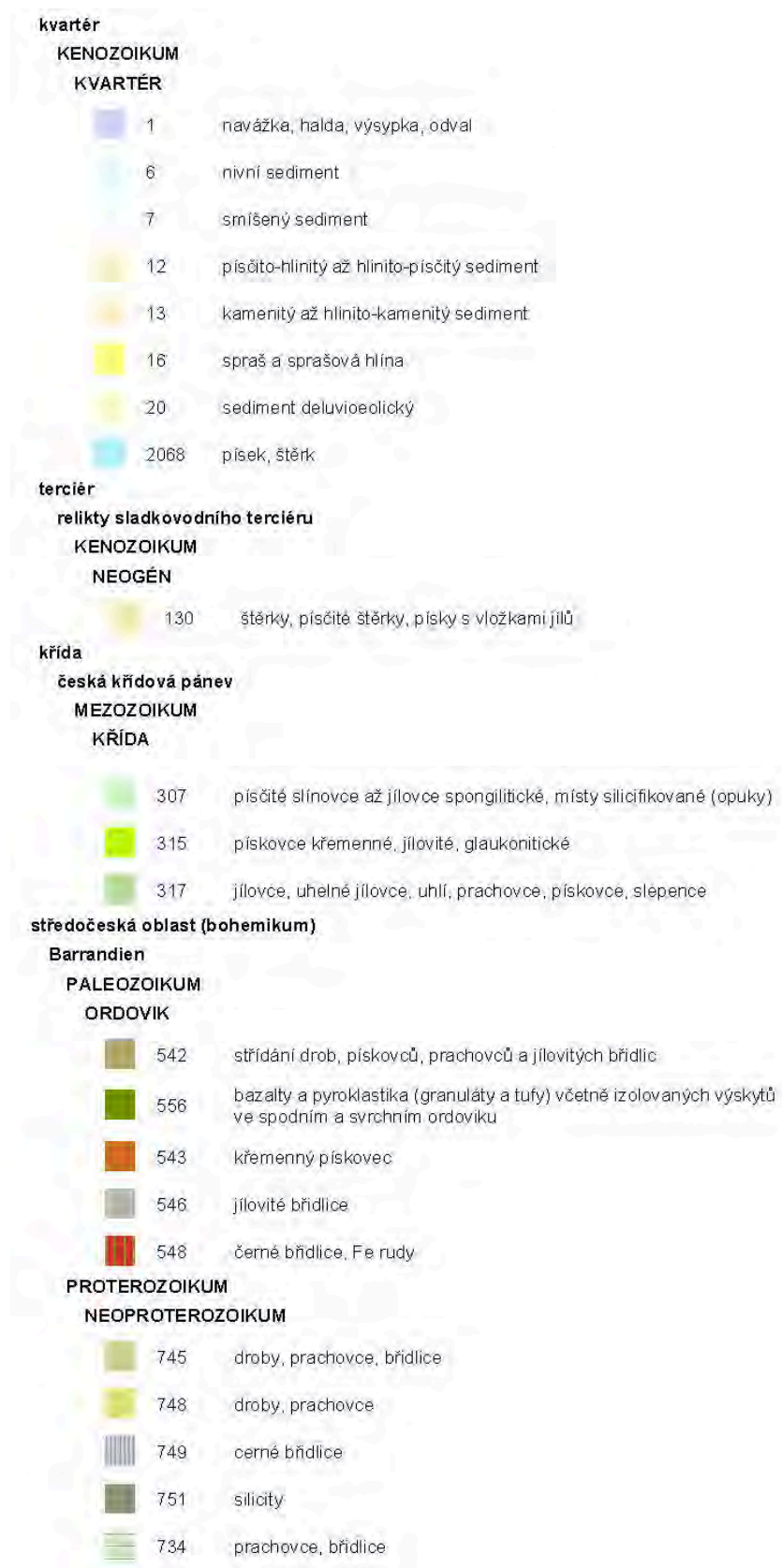
Obr. 1 – geologická mapa širšího zájmového území včetně legendy