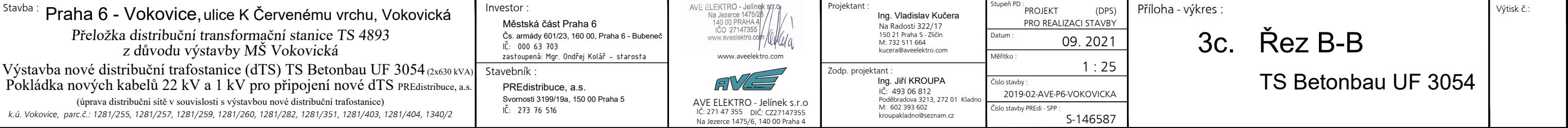
D2. SO 02 - Kabelové vedení VN a NN