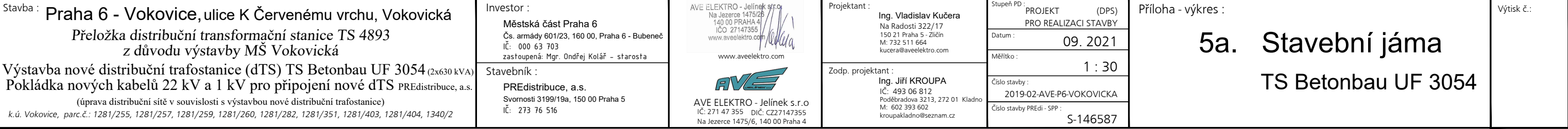
D2. SO 02 - Kabelové vedení VN a NN